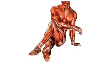
أقوى منتج صحي مشترك في الأردن، فقط 3 قطرات في اليوم وسوف تنسى آلام الظهر والمفاصل JointFlex | Sponsored