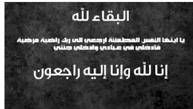
صحيفة عمون : وفيات السبت 24/2/2024