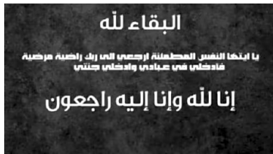
صحيفة عمون : وفيات السبت 24/2/2024