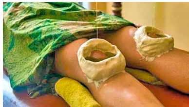
أقوى منتج لصحة المفاصل في الأردن، ثلاث قطرات فقط في اليوم وسوف تنسى آلام الظهر والمفاصل JointFlex | Sponsored

وطالبت الحملة بالإفراج الفوري عن الكاتب موفق محادين والدكتور سفيان التل ، ودعت كل منظمات حقوق الإنسان والهيئات الحقوقية ومؤسسات المجتمع المدني برفع صوتها في مواجهة هذه السياسة الحكومية واعتبار قضيتهم قضية رأي عام والمطالبة بالإفراج الفوري عنهما.