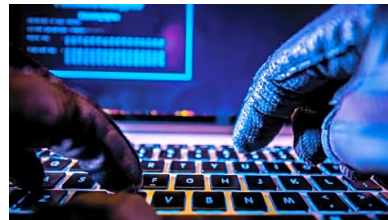
صحيفة عمون : تسريب ضخيم لبيانات حكومات وناشطين