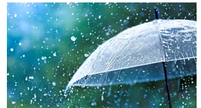
صحيفة عمون : أجواء باردة نسبياً في أغلب المناطق نتيجة حالة عدم الاستقرار