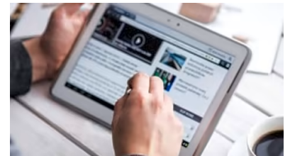
أعلن على هذا الموقع الرائد و 2000 موقع آخر مع شبكة Jubna بدأ حملك اليوم | Sponsored