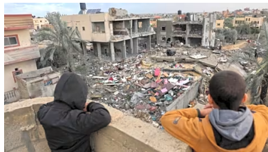
صحيفة عمون : روبرت: محادثات الهدنة بدأت في باريس منذ أسابيع